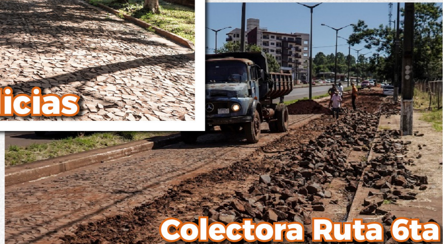
Colectora Ruta 6ta