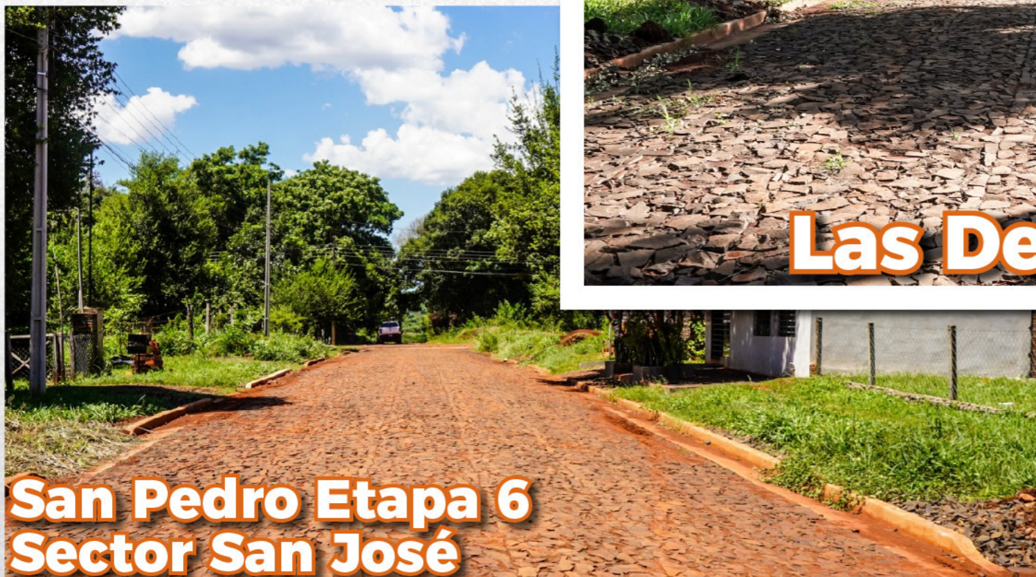
San Pedro Etapa 6 Sector San José