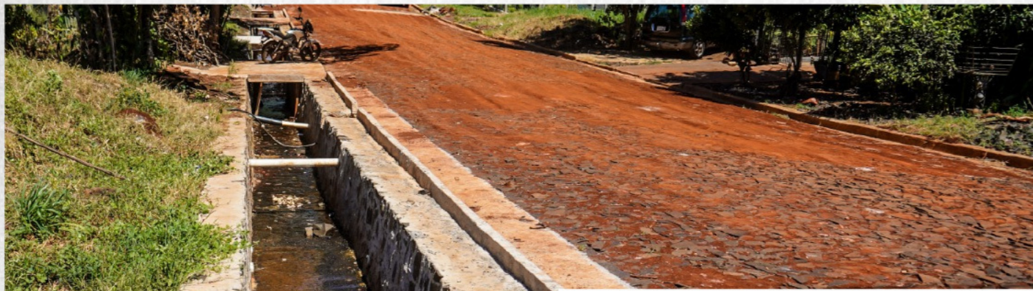
Barrio Curupayty Sector Parque 2